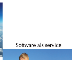
Software als service